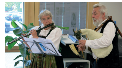
Duo „Regensburger Bordonmusik“